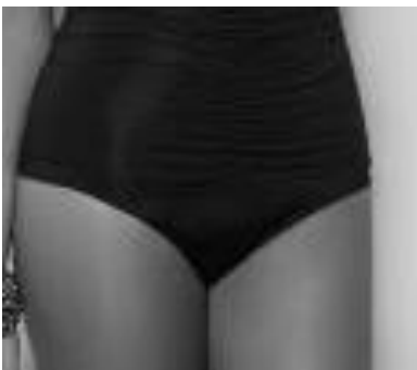
Denne skjæringen er godkjent.